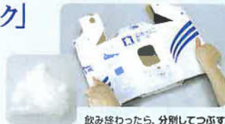
飲み終わったら、分別してつぶす。

D-パックには、簡単・コンパクトにつぶせるようにミシン目を入れました。空になった袋と箱はコンパクトにつぶせて、簡単に処分していただけます。リターナブルボトルを回収に出す手間も省けます。